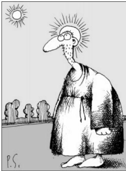
Рисунок С. АРХАНГОЛОВА

Не могу сослаться ни на какие документы. Кто меня знает — поверьте.