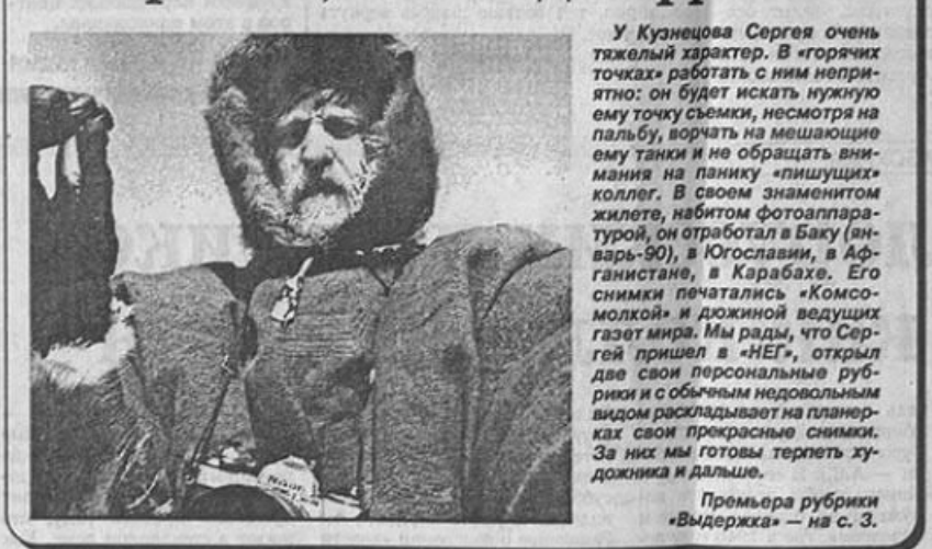
Премьера рубрики «Выдержка» — на с. 3.